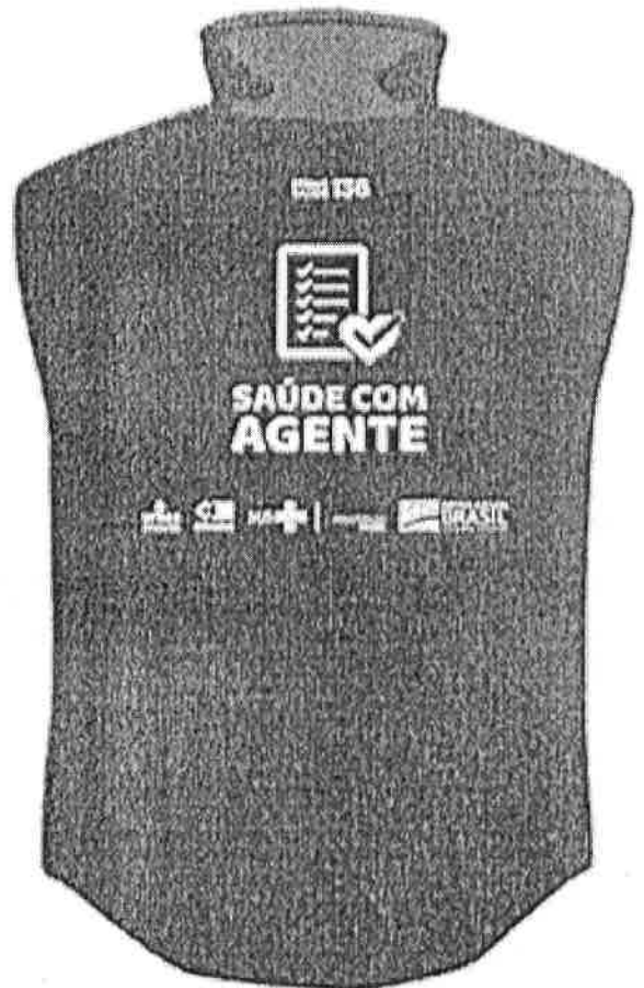
parte de trás