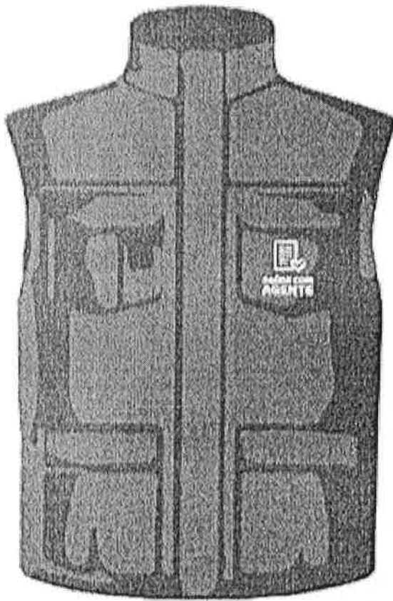
parte da frente