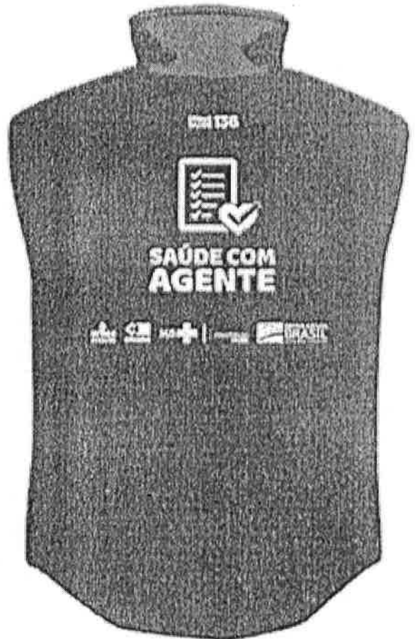
parte de trás