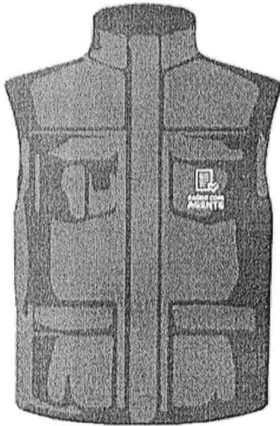
parte da frente